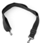
Schulter-Tragegurt für Rugged Boot