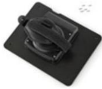
Rotierender Hand Strap mit Akkufach