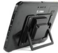
Kickstand / Desktop Ständer