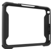
Rugged Boot Kompatibel mit Tastatur