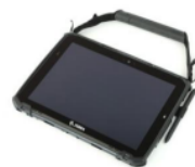
Hand-Tragegurt für Rugged Boot